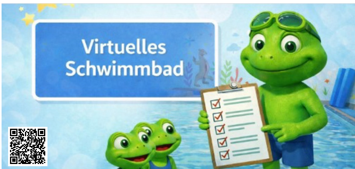
Virtuelle Schwimmbad –Gefährdungsbeurteilung (Screenshot, Abbildung: present4D, vr-suite.com)

Um Lehrkräfte bei der Vorbereitung und Durchführung eines sicheren Schwimmunterrichts noch besser zu unterstützen, stellt das Land Baden-Württemberg künftig das innovative digitale Tool Virtuelles Schwimmbad , welches vom ZSL im Auftrag des Kultusministeriums entwickelt wurde, zur Verfügung. Es sensibilisiert für mögliche Gefahren im Schwimmunterricht und unterstützt Lehrkräfte dabei, eine individuelle Gefährdungsbeurteilung für das jeweils genutzte Schwimmbad zu erstellen. Ergänzend stehen Materialien zur Verfügung, mit denen Schülerinnen und Schüler bereits im Klassenzimmer auf den Schwimmunterricht vorbereitet und für Gefahren sensibilisiert werden können.