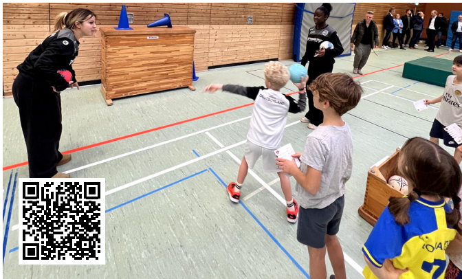
Grundschulaktionstag 2025 an der Zeppelin Schule Fellbach (BWHV)

Der Aktionstag zielt darauf ab, möglichst vielen Kindern den Einstieg in die Sportart Handball zu ermöglichen, Teamkoordination und Ballfertigkeiten zu fördern und den Spaß an Bewegung zu wecken. Gemeinsam mit regionalen Handballvereinen können Grundschulen einen abwechslungsreichen Aktionstag gestalten. Zudem haben die Kinder in zwei Schulstunden Gelegenheit, das offizielle Handball-Spielabzeichen des DHB – den Hanniball-Pass – zu absolvieren, eigene Fähigkeiten zu testen und über Spielformen gemeinsam in Aktion zu kommen.